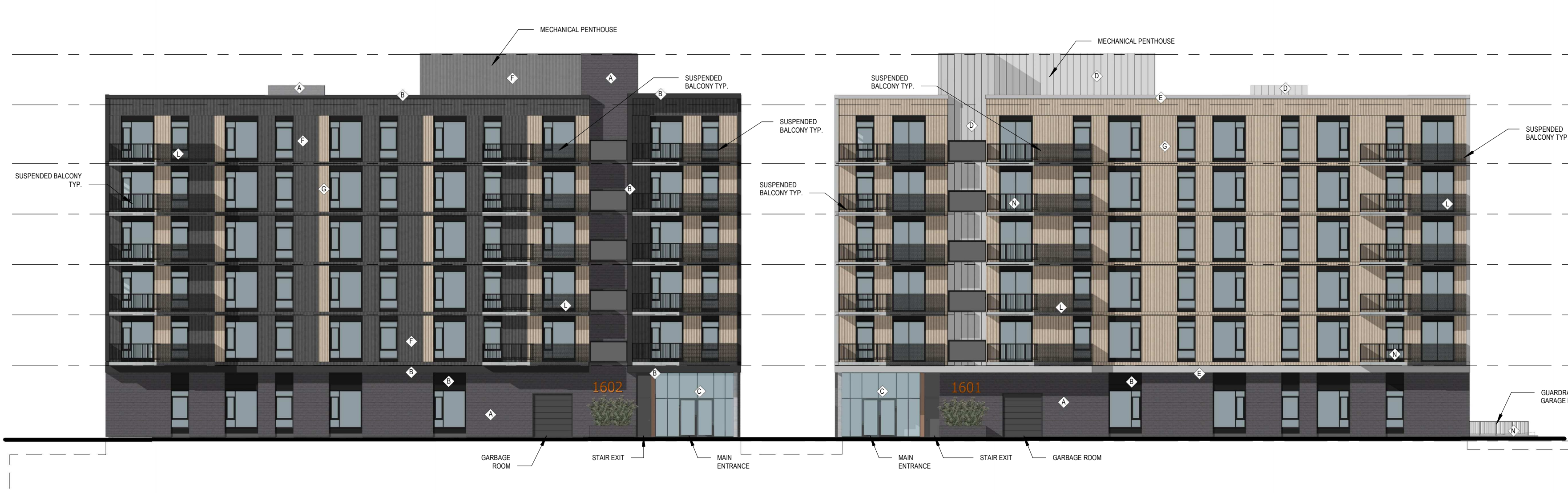
1 MIDRISE - EAST ELEVATION A.200 ÉCHELLE / SCALE: 1:200