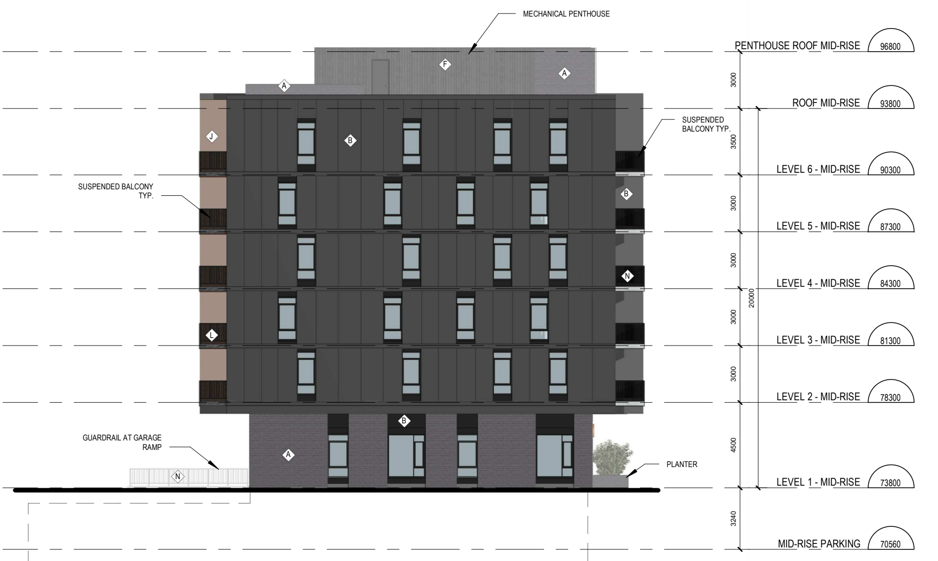
6 MIDRISE BLOCK D - SOUTH ELEVATION A.200 ÉCHELLE / SCALE: 1:200