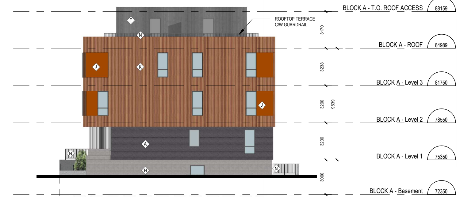
2 TOWNHOME BLOCKS A AND C - SOUTH ELEVATION A.201 ÉCHELLE / SCALE: 1:200