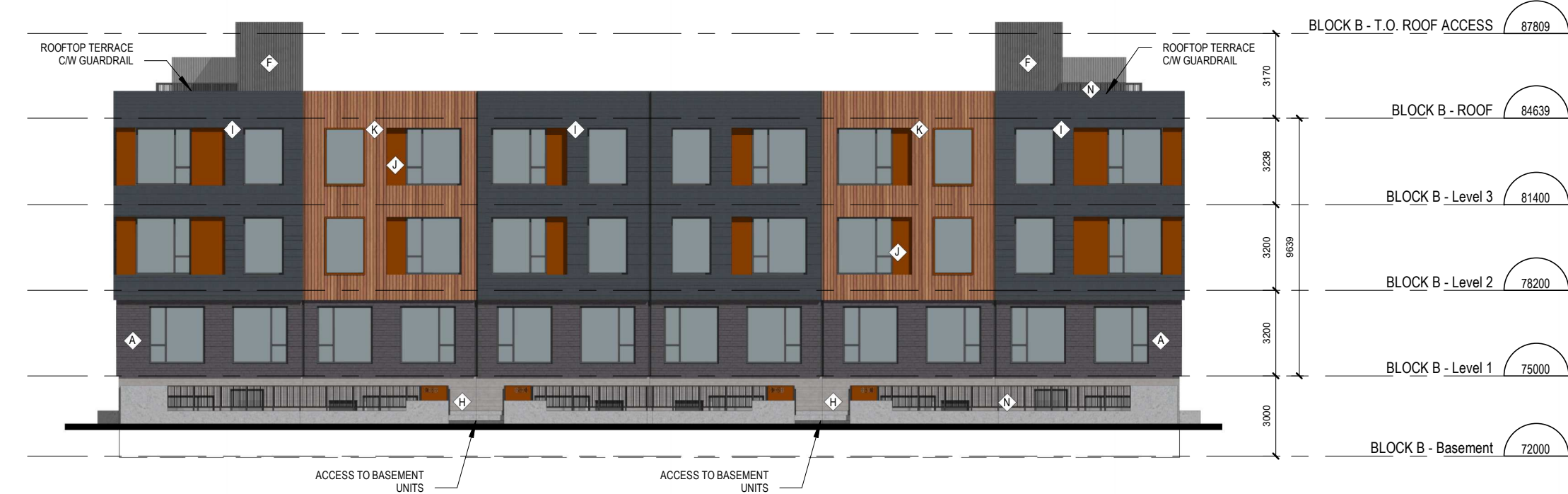
8 TOWNHOME BLOCK B - EAST ELEVATION A.201 ÉCHELLE / SCALE: 1:200