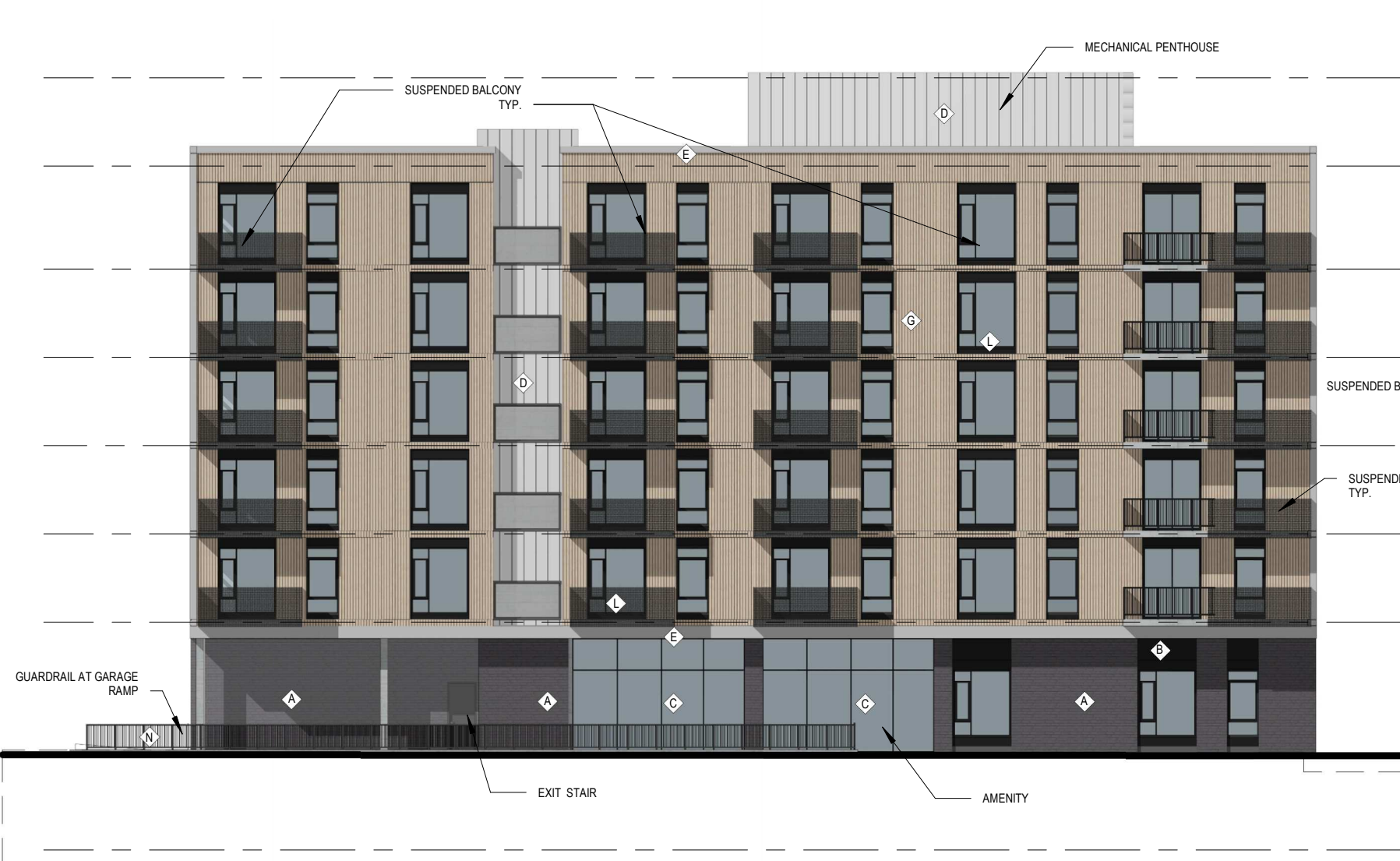
3 MIDRISE - WEST ELEVATION A.200 ÉCHELLE / SCALE: 1:200