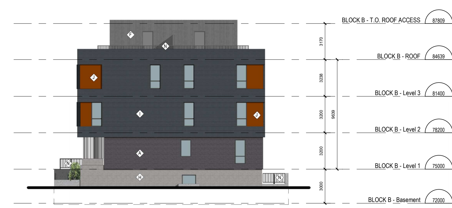
6 TOWNHOME BLOCK B - SOUTH ELEVATION A.201 ÉCHELLE / SCALE: 1:200