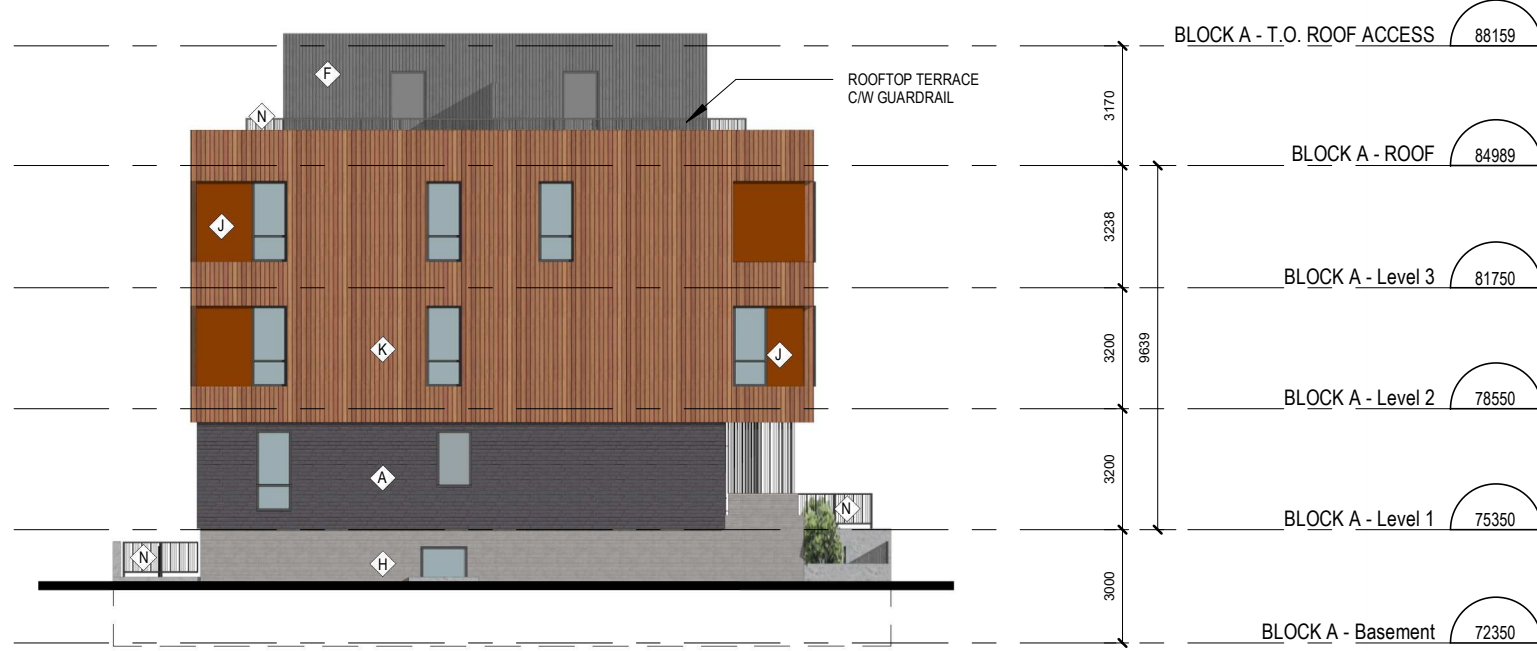
3 TOWNHOME BLOCKS A AND C - NORTH ELEVATION A.201 ÉCHELLE / SCALE: 1:200