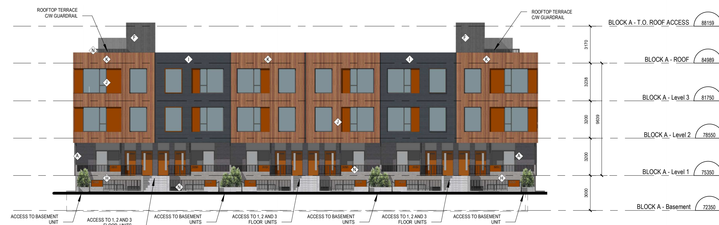
1 TOWNHOME BLOCKS A AND C - WEST ELEVATION A.201 ÉCHELLE / SCALE: 1:200