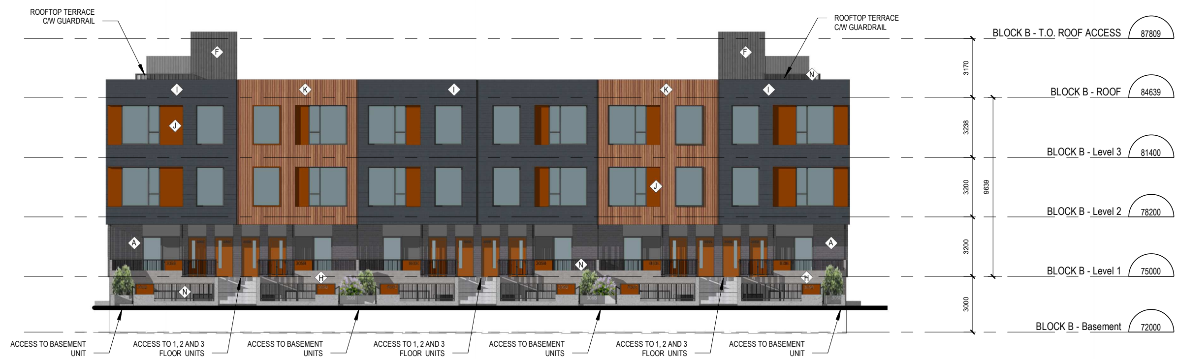
5 TOWNHOME BLOCK B - WEST ELEVATION A.201 ÉCHELLE / SCALE: 1:200