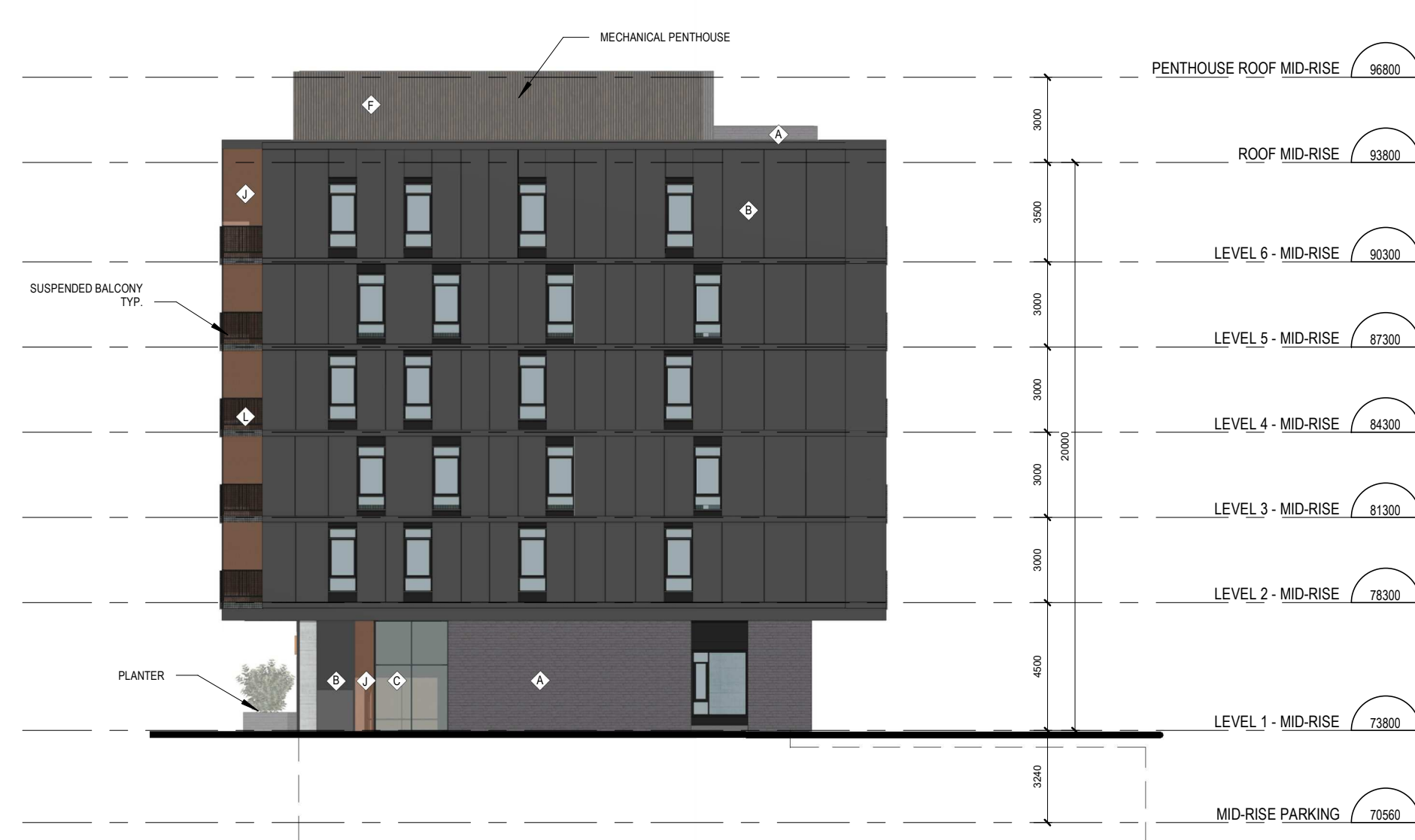
5 MIDRISE BLOCK D - NORTH ELEVATION A.200 ÉCHELLE / SCALE: 1:200