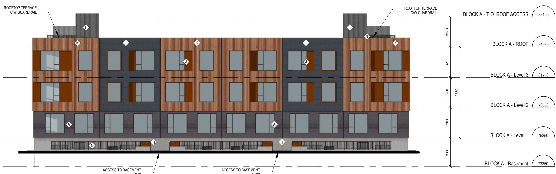
4 TOWNHOME BLOCK A AND C - EAST ELEVATION A.201 ÉCHELLE / SCALE: 1:200