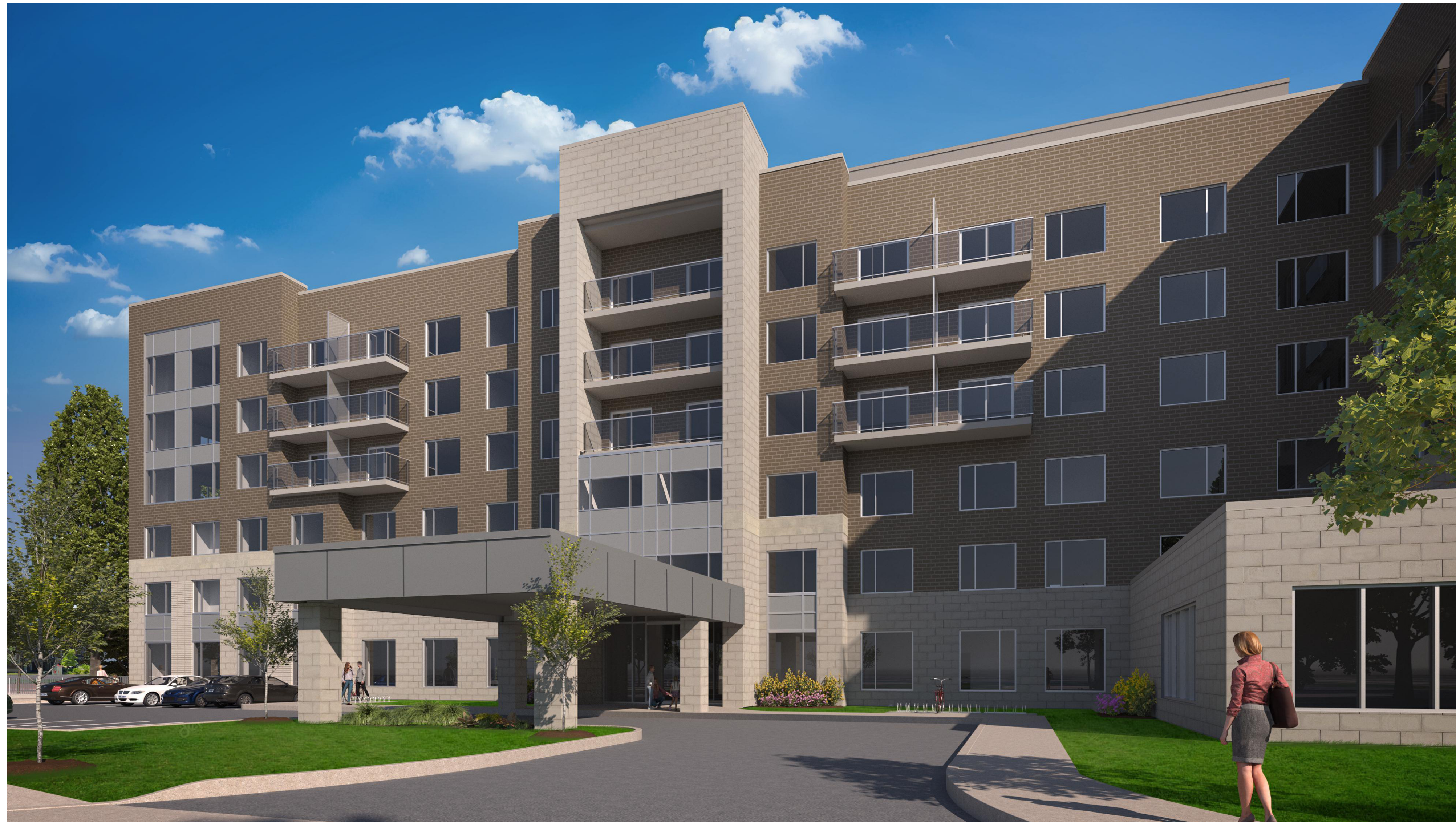
3D VIEW LOOKING NORTH FROM DÉCOEUR DR.