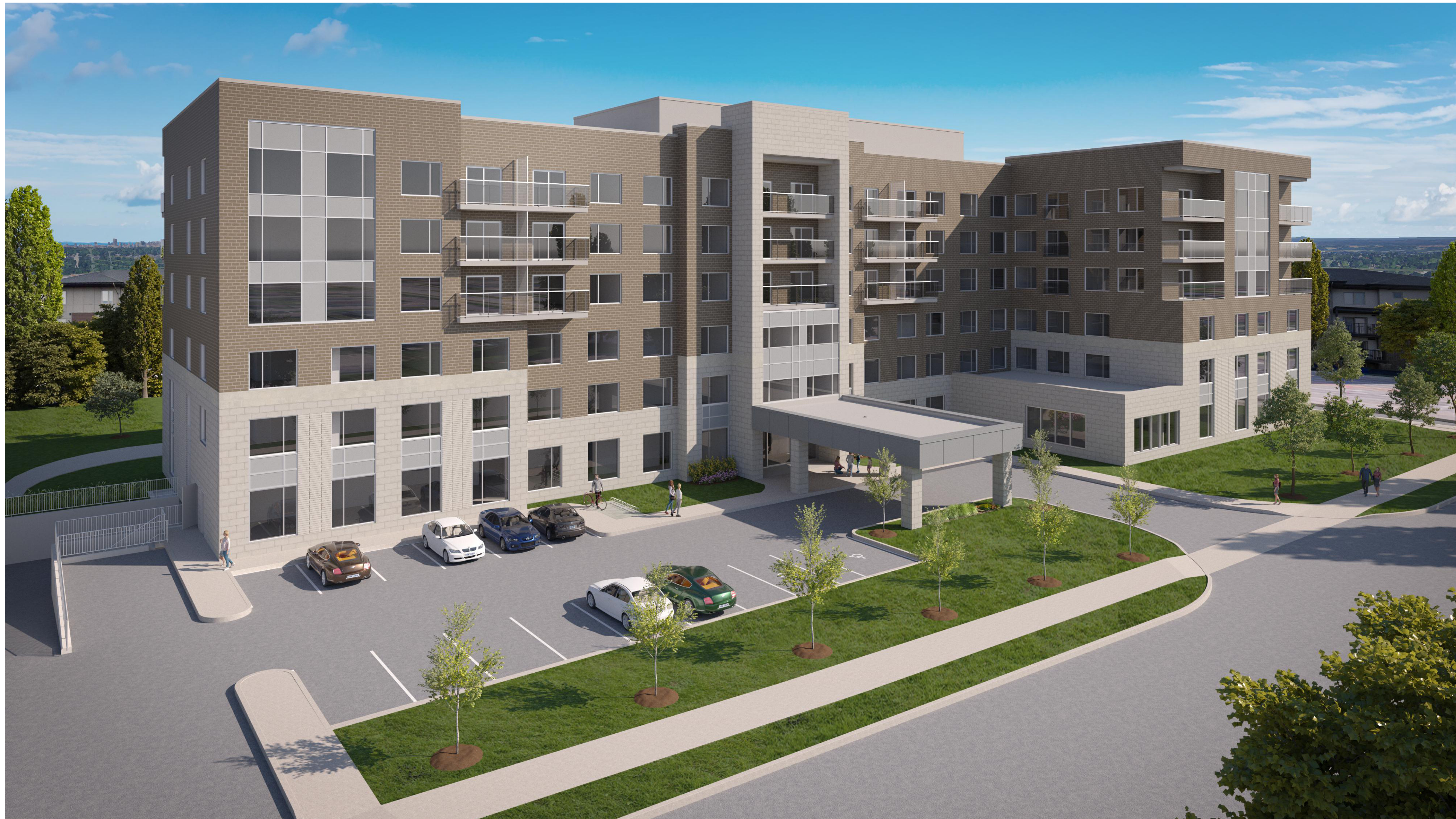
3D AERIAL VIEW LOOKING NORTH FROM DÉCOEUR DR.