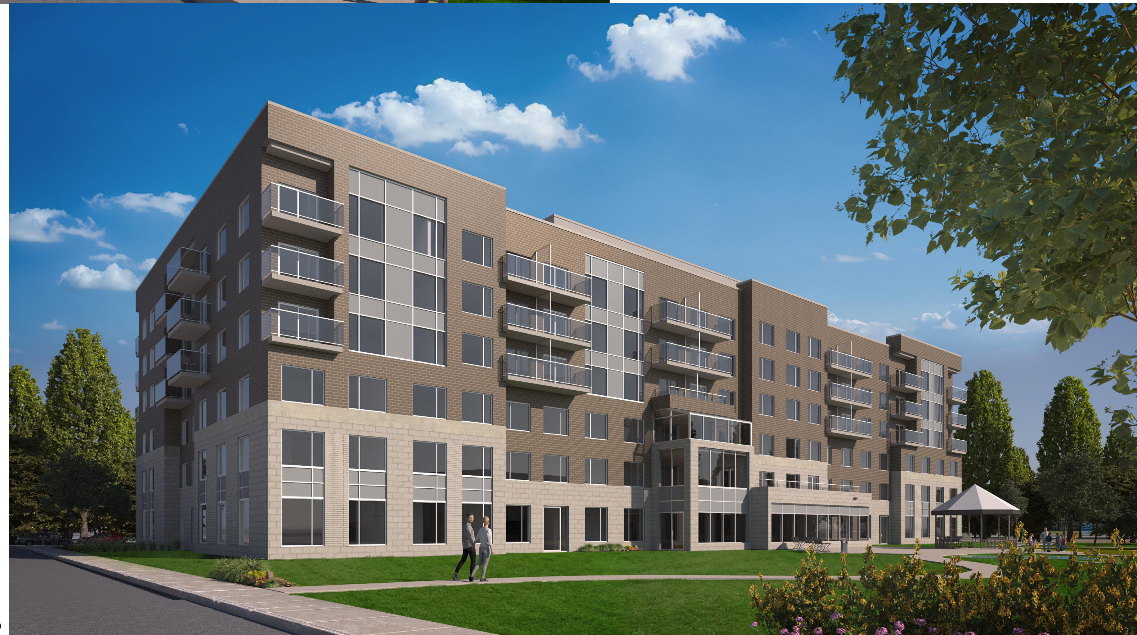
3D VIEW LOOKING SOUTH FROM TENTH LINE ROAD